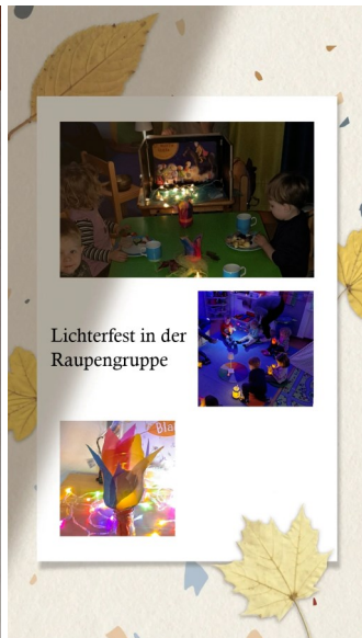
Lichterfest in der Raupengruppe