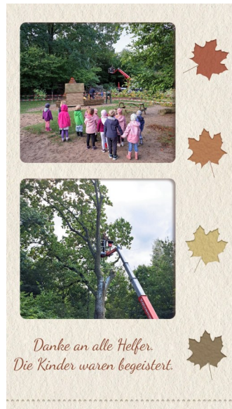
Danke an alle Helfer. Die Kinder waren begeistert.