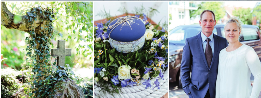
Heinz und Anja Beutler

Erd-, Feuer- und Seebestattung sowie unverbindliche Vorsorgeberatung Treffen Sie die großen Entscheidungen im Leben selbst! Wir beraten Sie gerne.