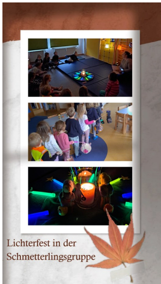
Lichterfest in der Schmetterlingsgruppe

Aber nicht nur so große Ereignisse haben uns im Kiga dieses vergangene Jahr beschäftigt. Auch kleine Anlässe gaben uns wieder einen Grund zur Freude. Das war zum einen ein ganz toller Oma-Opa-Tag, wieder ein superschönes Schlaffest mit den Vorschulkindern, da nochmal herzlichen Dank an die Feuerwehr aus Engelau, oder aber