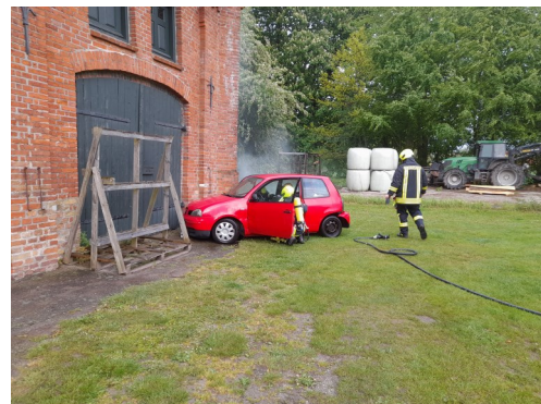
Bei diversen praktischen Übungen lag der Schwerpunkt in der technischen Hilfeleistung, die einen immer größeren Anteil der Einsätze einnimmt. Auf Gut Neuhaus wurde bei einer praktischen Übung ein PKW-Unfall mit einer eingeklemmten Person simuliert.

Wer im vergangenen Jahr am ehemaligen Autohaus am Schmiedeberg vorbeigekommen ist, konnte rege Bautätigkeiten feststellen: Die Kameradinnen und Kameraden der Wehr haben viele Stunden mit den Abbrucharbeiten und der Umgestaltung des Objektes verbracht. Die Ergebnisse können sich sehen lassen und alle Beteiligten freuen sich schon sehr auf das neue Feuerwehrhaus!